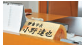
市長デスクにある名札

何より大切にしたいのは、市民の「みんなが」というところ。私がリーダーシップを発揮し、地域の皆さんの声をしっかりと吸い上げ、「市民の声が届く市政」へダイナミックな政策の転換を進めていきたいと考えております。それでは、次ページ以降で、この3本の大きな柱について具体的に話させていただきます。