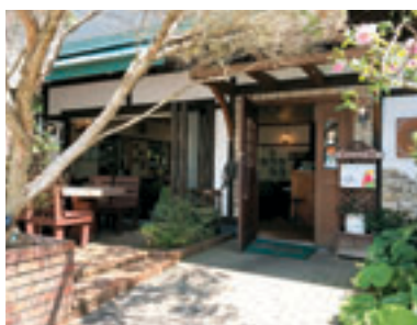
伊豆急行線城ヶ崎海岸駅から 徒歩3分のところにある