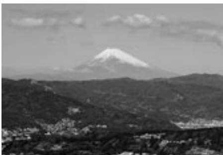
小室山山頂から見た富士山