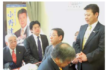
事務所内で新年顔合せ会を行ない国会議員や市長・市議・団体代表と今年の政治方針などを話し合いました。