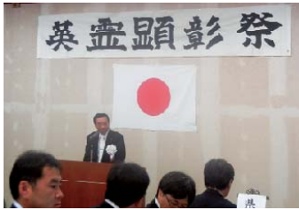
静岡護国神社での英霊顕彰祭に毎回参加しています。伊東市からも遺族会の方が沢山集まりました。