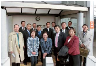
医療福祉特別委員会で県内の視察を行いました。(伊東市湯川の栄光保育園での研修)