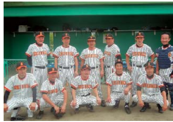
全国都道府県議員野球大会が復興を目指す宮城県仙台市で開かれ中心選手として参加しました。