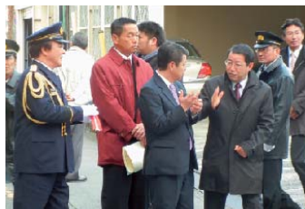
消防出初式で伊東市長、市議会宮崎議長と消防団支援について議論。連携し取り組むことを確認しました。