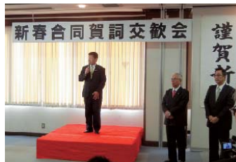
伊東商工会議所で政治・経済会の新春合同賀詞交歓会が開かれ、参加された方々からは例年にない期待感を感じました。