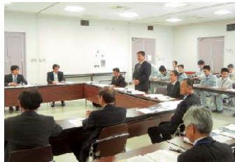
岩手県釜石市では建設委員会を代表し、挨拶をしました。静岡県からは7名が派遣されていて現地で激励いたしました。