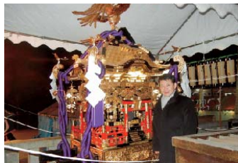
元日の未明、来宮神社に飾られていた歴史ある神輿です。県内の様々な神社には初詣客が参拝されました。