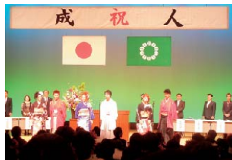
今年の成人式典には大勢の方(592名)が参加し、立派な社会の一員として、二十才の誓いをされました。