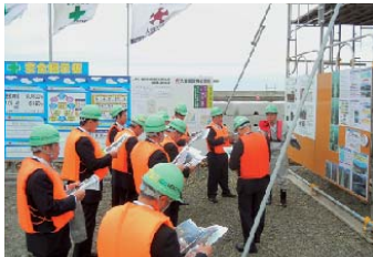
宮城県岩沼市で復興工場の説明を受け、静岡県議会で建設委員会において防災計画を審議します。