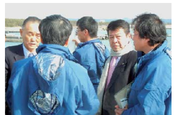
建設委員会で浜松市の津波対策と砂浜の浸食対策を現地視察しました。6月までに計画が決定します。