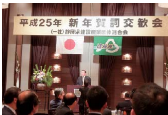
小楠県議会議長とともに静岡県建設産業団体連合会の賀詞交歓会に出席。参加者は期待に満ち活気がありました。