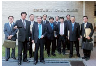
福祉施設事業の現場の声として三団体の方からお話を伺いました。(いこいの里 奥野園)