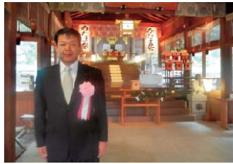
護国神社社殿においてみたま祭りの際、県議代表団の一人として玉串を奉納いたしました。