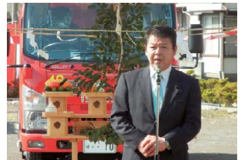
伊東市消防団第10分団に新しくポンプ車が配置され、入魂式に参列しました。市民と来訪者を守るたくましい団員に敬意を表しました。