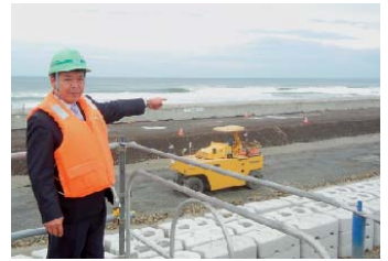
建設委員会で岩手・宮城両県の復興の状況を視察いたしました。現在は着々と工事が進んでいます。